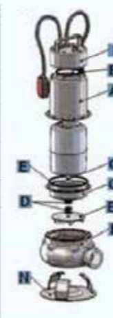
TABELLA MATERIALI / MATERIALS TABLE